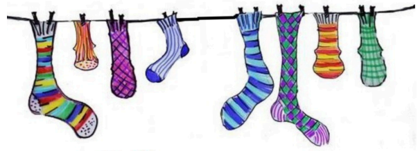
Giornata dei Calzini Spaiati